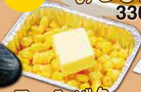
コーンバター 390円(税込429円)