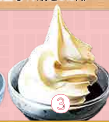
③ コーヒーゼリーソフト