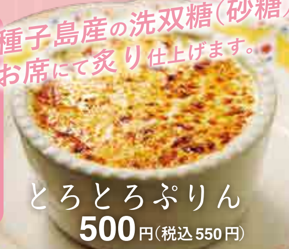
とろとろぷりん 500円(税込550円)