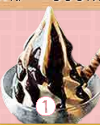
① チョコレートサンデー