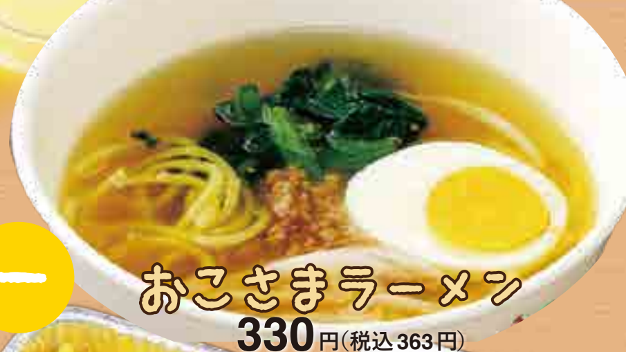
おこさまラーメン 330円(税込363円)