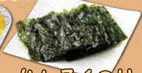
かんこくのり 220円(税込242円)