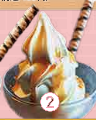
② キャラメルサンデー