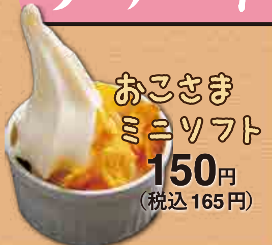
おこさまミニソフト 150円(税込165円)