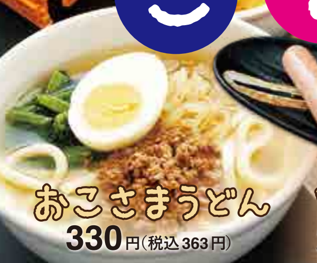
おこさまうどん 330円(税込363円)