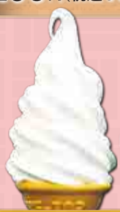
ソフトクリーム 330円(税込363円)