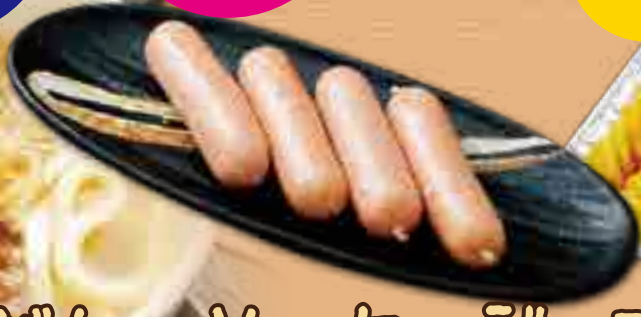
ソーセージ 290円(税込319円)